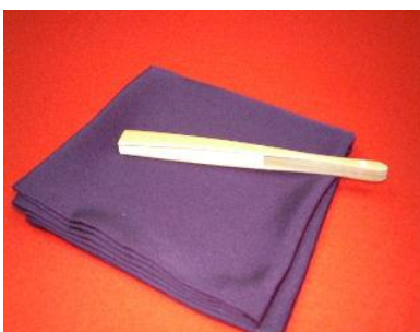
1-(17). 扇子+1-(18). 帛紗